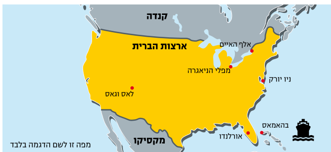
מפה זו לשם הדגמה בלבד

מזון ושתייה בשפע, בריכות שחיה, חדרי כושר, מגלשות מים ועוד.